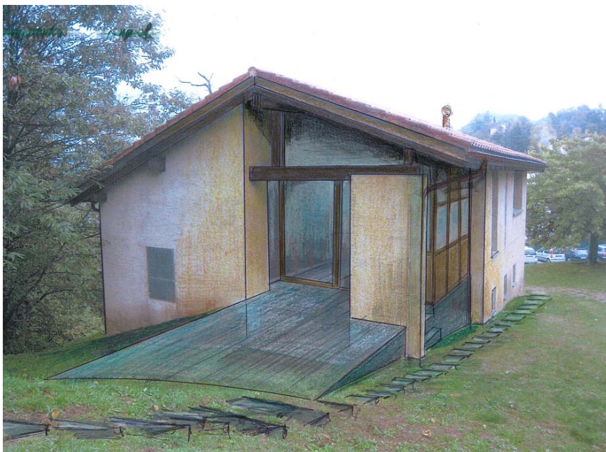
Fotomontaggio facciata sud-est