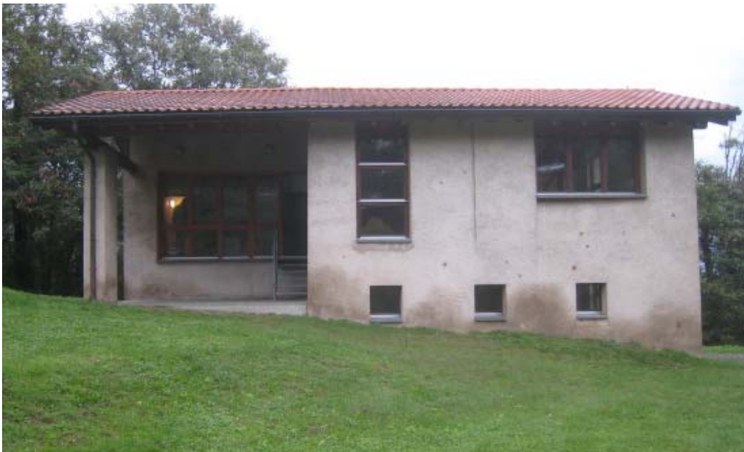
Immagine Roccolo di Castell