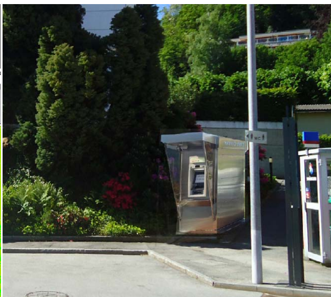
Figura 2: pianta posa "cabina bancomat" Figura 3: fotomontaggio indicativo

La struttura sarà collegata alla rete elettrica e alla linea telefonica.